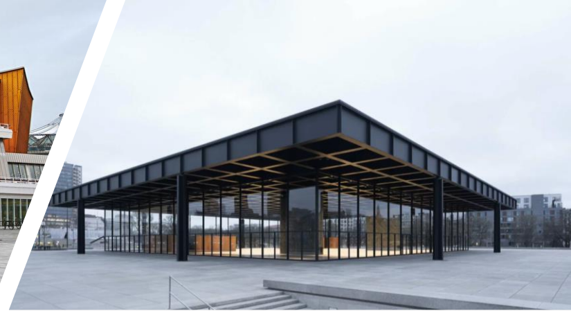
Neue nationale Galerie