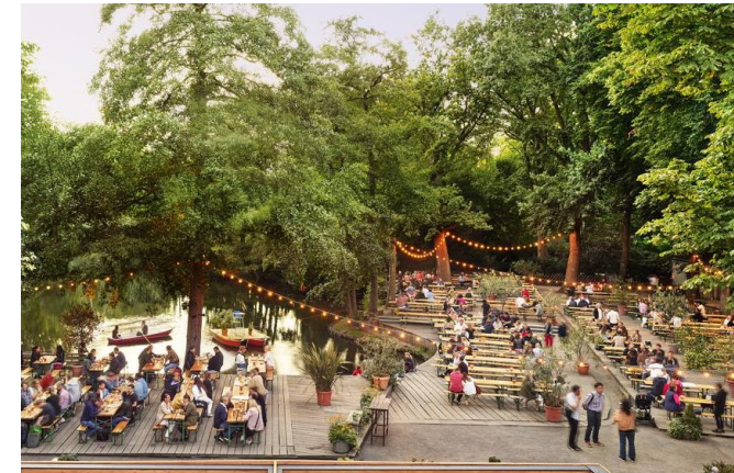
Café am neuen see