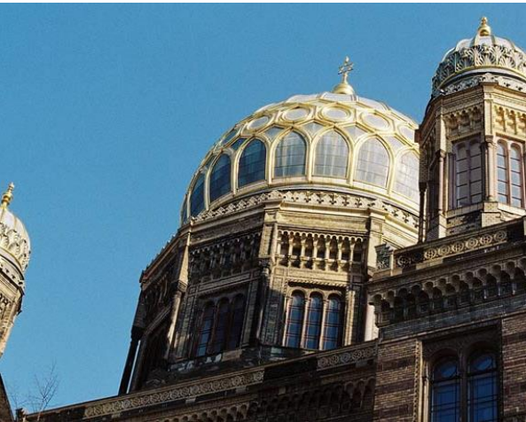
Quartier des Granges